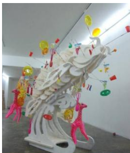
Chinoiserie au Japon ©

Moreno , résidence d'artiste La Paz Bolivie. 2004 ©